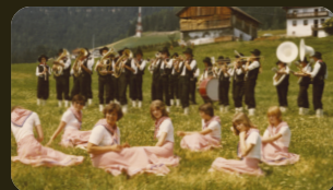
Tirolerreise in den 1970ern