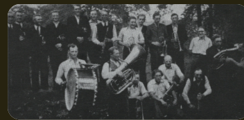
Gruppenbild im Dullgorn 1952