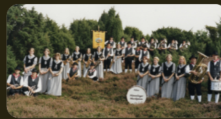
Gruppenbild im Wacholderhain 1998

100 JAHRE HÜMMLINGER MUSIKANTEN Börger e.V.